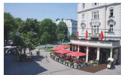
Das Restaurant »Liechtenstein42«