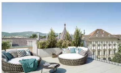
360° Ausblick auf das Gartenpalais Lichtenstein, den Kahlenberg, die Votivkirche & den Stephansdom

Mit dem Ausbau der Etage IV, des Dachgeschosses und der Dachterrasse wird das historische Gebäude um eine moderne Welt auf Dachebene erweitert - modernster Komfort und exklusive Eleganz halten Einzug. So entsteht im Herzen Wiens ein geschichtsträchtiges Juwel, welches das besondere Flair des späten 19. Jahrhunderts als einzigartige »Art de Vivre« inszeniert.