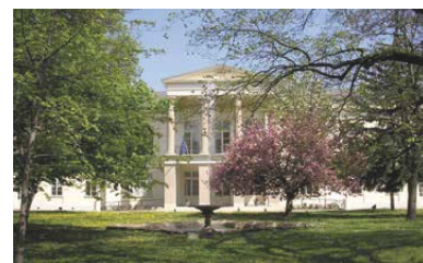
Das Palais Clam-Gallas