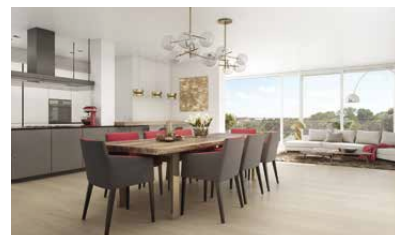
Sonniges Ambiente lädt zum Verweilen ein