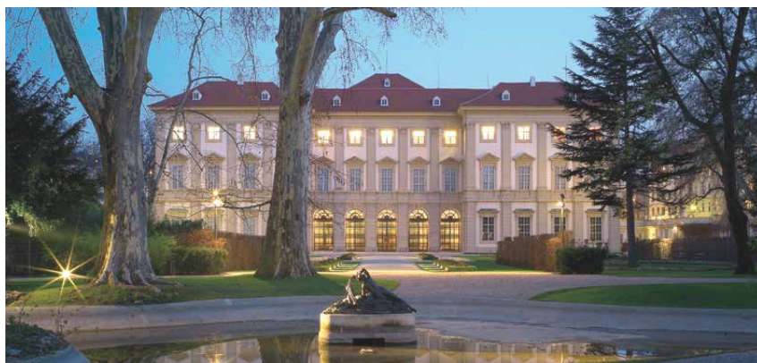
Das Gartenpalais Liechtenstein