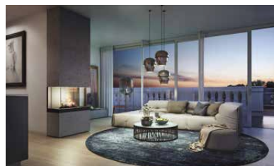
Sonnenuntergang am Kamin im Luxus-Penthouse